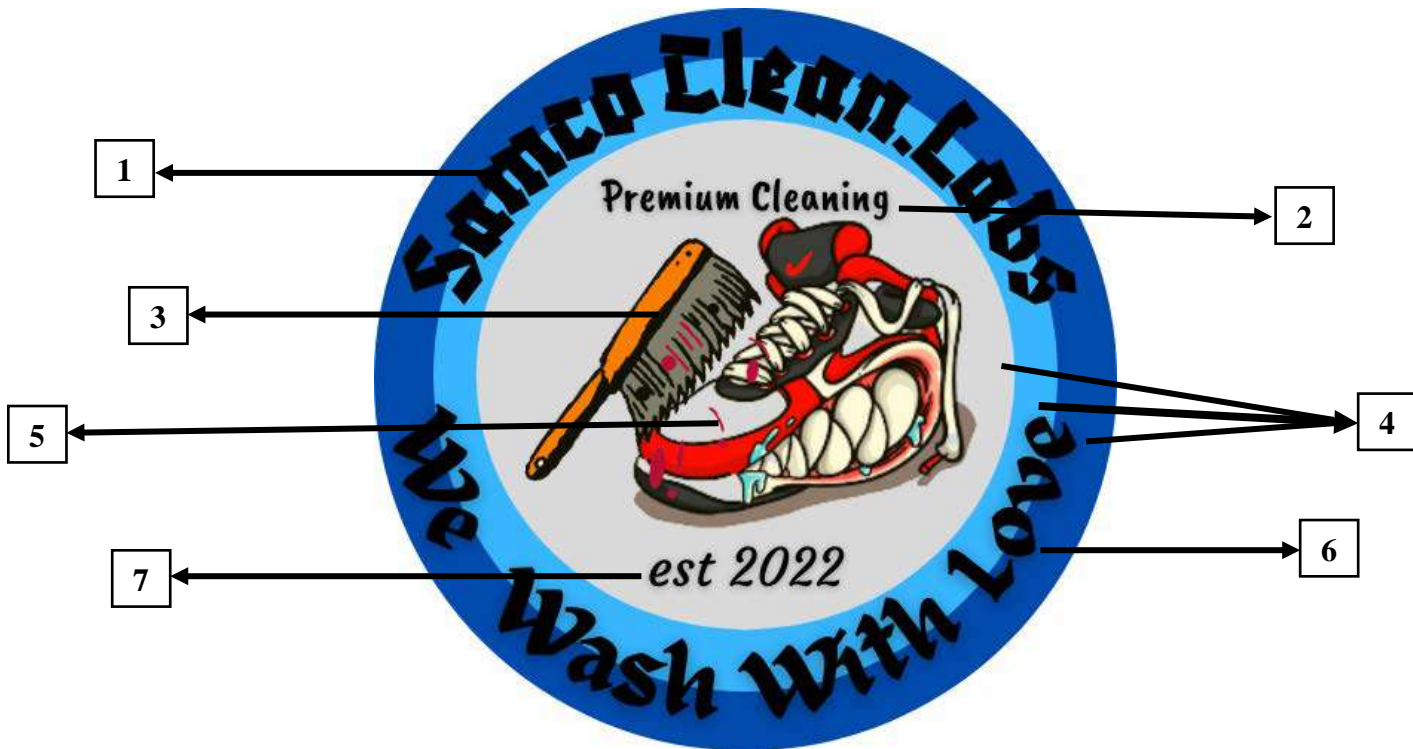
Gambar 1. 1 Logo Samco Clean.Labs

ini dan cara membersihkan sepatu Anda dengan benar. Selain itu, logo ini mewakili keinginan perusahaan untuk tetap konsisten di bidangnya. Di bawah ini adalah deskripsi logo SamcoClean. Lab